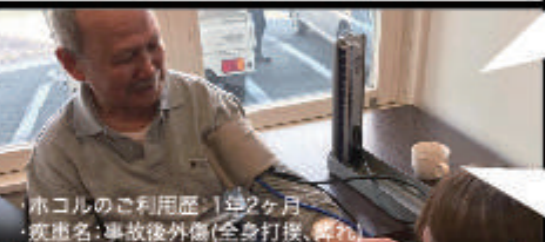
ホコルのご利用歴：1年2ヶ月 疾患名：事故後外傷(全身打撲、痺れ)

第1回の熊本城マラソンを最後に、事故にあっ てしまいマラソンからは遠ざかっていました。でも もう一度、あの時のように走りたいのです