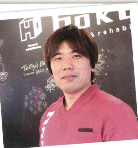
結果が出せる理学療法士であり続けたい