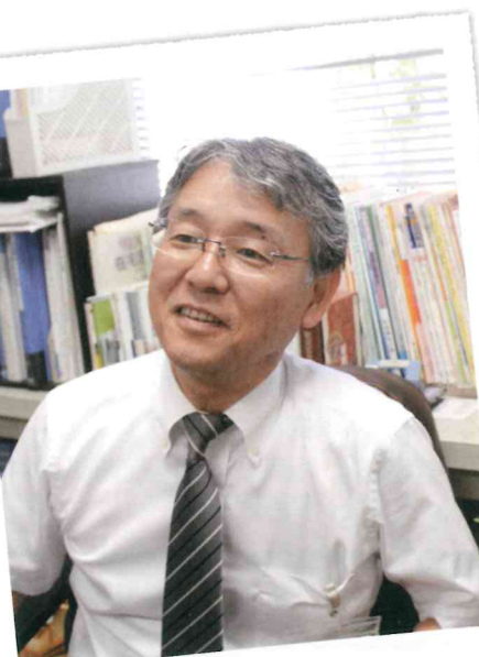
誰もが安心して暮らせる社会に!