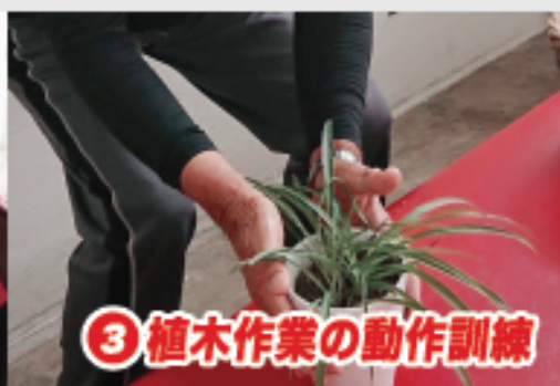
③ 植木作業の動作訓練

麻痺の影響で、右上下肢がうまく動かせないため、植木の手入れ作業を行う際にふらつきが見られていた。そのふらつきを体幹の筋力でカバーし、安定性を高め、円滑性の向上を図った。