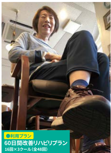
●利用プラン 60日間改善リハビリプラン 16回×3クール(全48回)