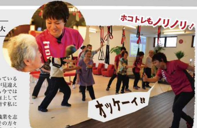
得意に感じご本人の了承を得ています。

私もホコルで働く理学療法士のようにになれる努力を続け、ご利用者の皆さんに絶えない笑顔を提供してホコルを盛り上げることが出来ればと思っています。まだまだ、不手際もありますがどうぞよろしくお願いいたします。