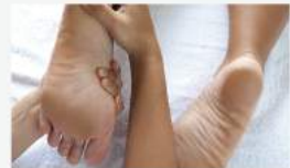
足反射区療法(足つぼ)