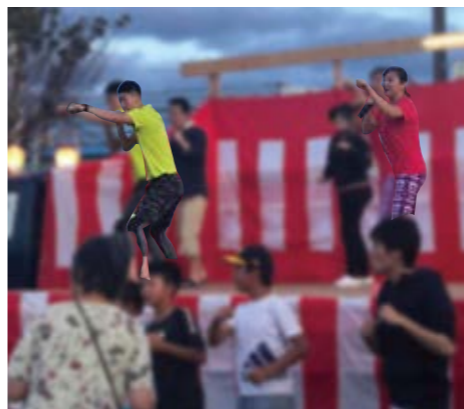
▲ 校区の夏祭りでの住民参加イベント主催

ウォークランの総合事業では介護保険内で高強度なトレーニングが受けられます。要支援1・2、事業対象者向けサービスです。