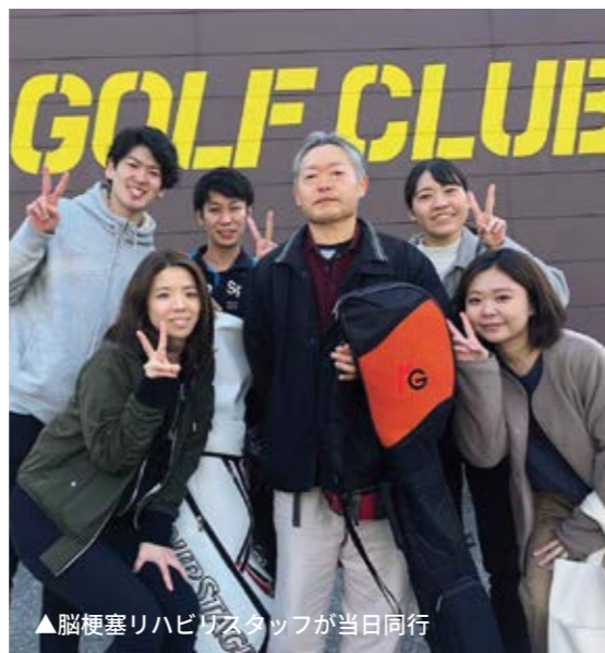
▲脳梗塞リハビリスタッフが当日同行