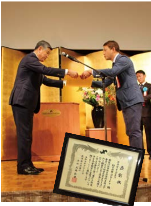
▲2019年11月11日受賞の様子