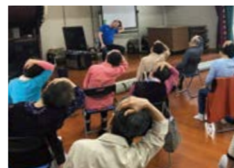
▲ 地域の健康サロンでのトレーニング指導