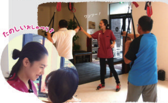
御礼に感謝して本人の了承を得ています。

このようにhokoruでは御利用者へのサービスの質の向上を目的に、おもてなしの教育を通して一人の人間造りにも取り組んでおります。