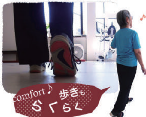
画像に關しご本人の了解を得ています。

ご利用者の声を貴重なデータとさせていただきます。関節に負担がかからずより歩行しやすいシューズをリリースでき、世の中の方々のお役に立てる事を目指しております。