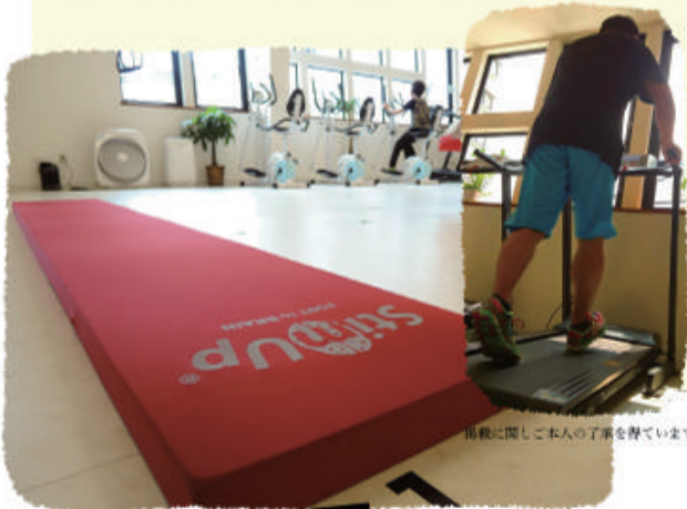
画像に關しご本人の了解を得ています。