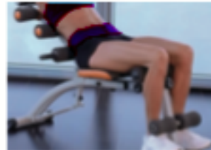
WALK RUN Core 話題沸騰、体幹トレーニングマシン