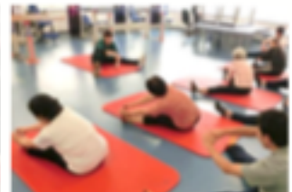
WALK RUN Stretch マットストレッチで柔らかく