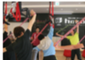
WALK RUN Band 初心者向けと上級者向けをご用意