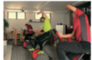
WALK RUN Bike ペダルを回しながら有酸素運動