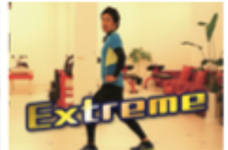
WALK RUN Extreme 看護士・理学療法士「作」のエアロビクス